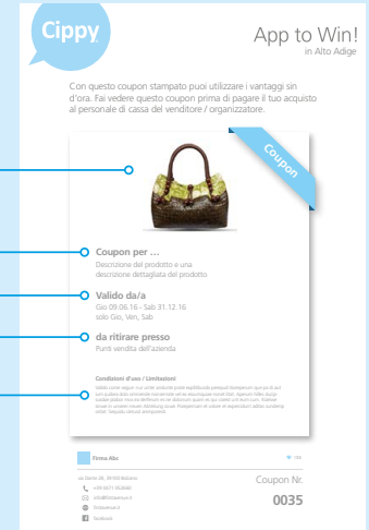
stampato da sito web